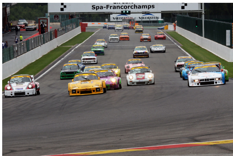
Startfoto Rennen B 2015