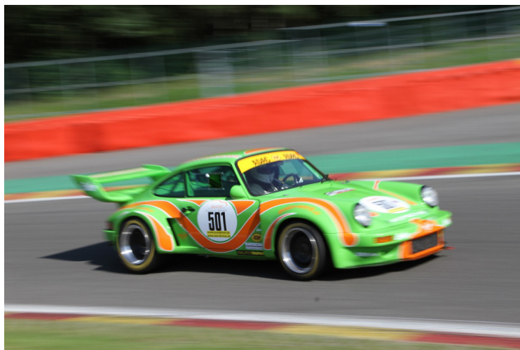
Stefan/Max Struwe (Porsche 911 RSR) Sieger Rennen B 2014