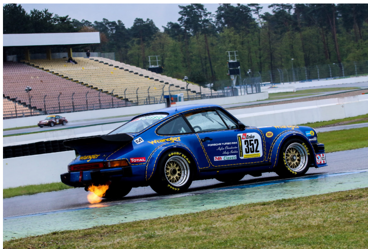
Stefan Oberdörster (Porsche 911 Turbo)