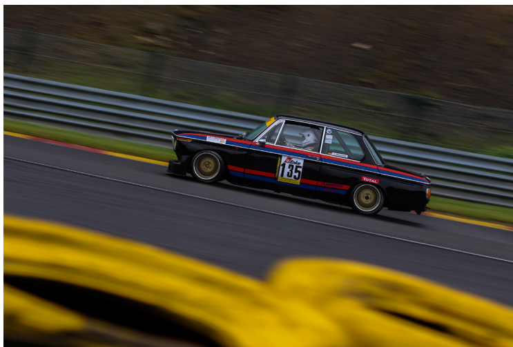
Uwe Klapproth (BMW 2002)